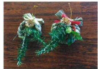
写真はイメージになります