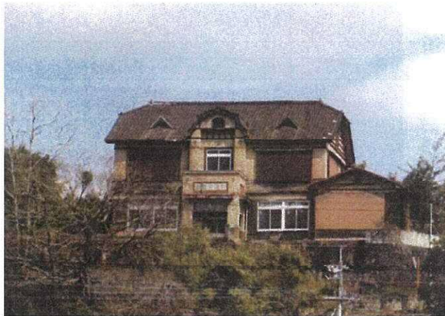
平成4年〜令和2年7月 空き家期