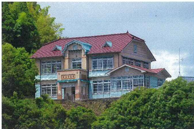
令和4年6月 復元工事 竣工